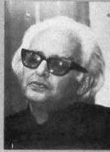
شکستہ رقیبانی کتابان (شخصیت اور ادبی خدمات)